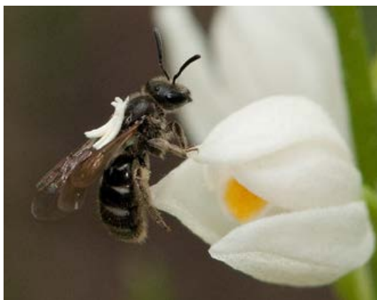
FIGUUR 4 Gladde groefbij ( Lasioglossum laeve ) met de banaanvormige polliniën van het Wit bosvogeltje ( Cephalanthera longifolia ) op zijn rug geplakt. La Bâtie, Frankrijk, 24 mei 2009 (foto: J. Claessens).

Bosvogeltjes behoren tot een primitief geslacht, waarbij nog geen kleefschijfje bij de polliniën ontwikkeld is (DRESSLER, 1993; PRIDGEON et al. , 2001). Daarom is een afwijkende manier ontwikkeld om de polliniën aan de bezoeker te bevestigen. Het Wit bosvogeltje wordt vooral bestoven door kleine groefbijtjes van de geslachten Halictus en Lasioglossum (CLAESSENS & KLEYNEN, 2011; CLAESSENS & KLEYNEN, 2013; CLAESSENS & KLEYNEN, 2016). Bezoekende bijtjes landen op de lip en buigen naar voren om de basis van de lip te bereiken. Daarbij stoten ze met hun rug tegen het stempelslijm, waarvan een kleine hoeveelheid op hun rug geplakt wordt [figuur 4]. Bij het terugtrekken stoot de met stempelslijm bedekte rug tegen de polliniën, de scharnierende anthere wordt omhoog