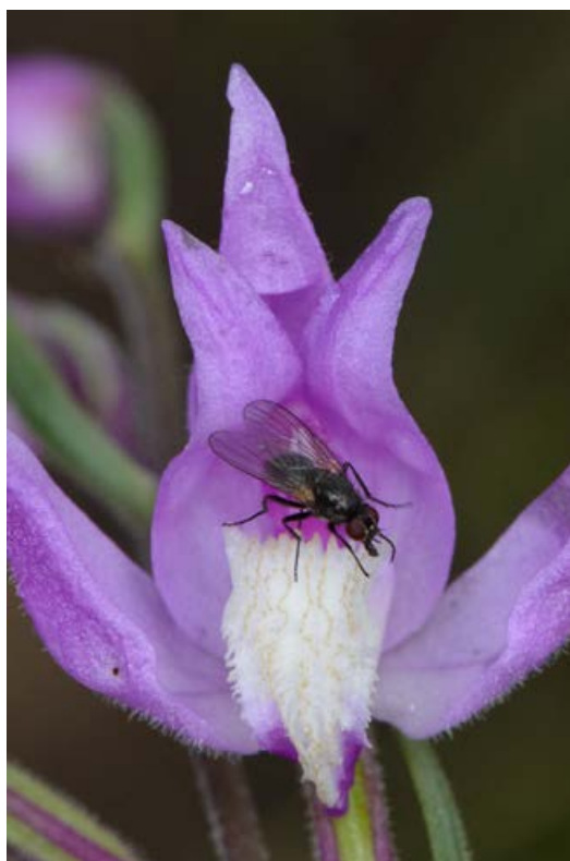
FIGUUR 5 Een vlieg inspecteert de lijsten op de lip van het Rood bosvogeltje ( Cephalanthera rubra ). Mittenwald, Duitsland, 11 juli 2014.

De lijsten op de lip trekken vaak vliegen aan, die voortdurend de kroesjes inspecteren [figuur 5]. Maar vliegen zijn slechts bezoekers en geen bestuivers van deze orchidee. Het Rood bosvogeltje is een klassiek voorbeeld van bestuiving door middel van mimicry: het imiteren van een voedselplant (DAFNI, 1984; JERSÁKOVÁ et al. , 2006; JERSÁKOVÁ et al. , 2012). De bloemen van deze orchidee reflecteren uv-stralen in hetzelfde bereik als verschillende klokjes- ( Campanula -) soorten (NILSSON, 1983; VÖTH, 1993). De reflectie van de orchidee komt zo sterk overeen met die van de klokjes-soorten dat mannetjes van verschillende bijengeslachten ( Chelostoma , Dufourea en Bombus ) die gewoonlijk in de klokjes foerageren of overnachten, verleid worden om de orchidee te